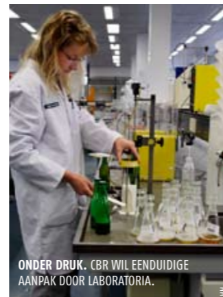
ONDER DRUK. CBR WIL EENDUIDIGE AANPAK DOOR LABORATORIA.

Het CBR vergelijkt deze werkwijze met de ademanalyse. De politie is daar ook niet verplicht de betrokkene op het recht van een bevestigingstest