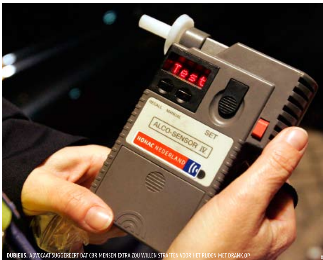
DUBIEUS. ADVOCaat SUGGEREERT DAT CBR MENSEN EXTRA ZOU WILLEN STRAFFEN VOOR HET RIJDEN MET DRANK OP.

van iemand als extra argument naast alleen de CDT-waarde. De voorgeschiedenis is dan dat iemand heeft gereden met drank op. Maar je komt natuurlijk pas in de invorderingsprocedure als je met drank op gepakt bent. Zo heeft iedereen in de invorderingsprocedure een extra argument naast de verhoogde CDT-waarde.'